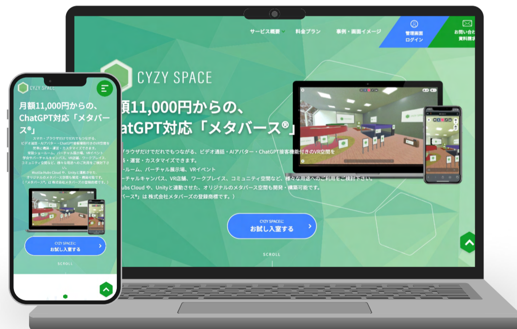
株式会社メタバース 様 CYZY SPACE