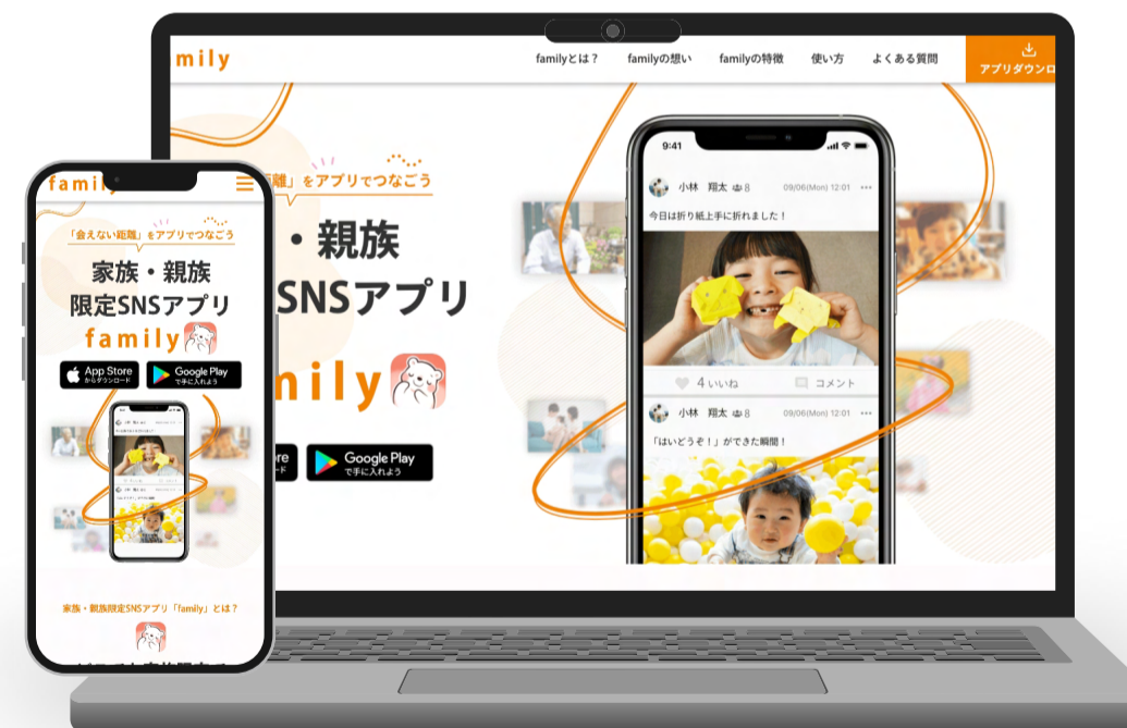
Family 様 家族・親族限定SNSアプリ