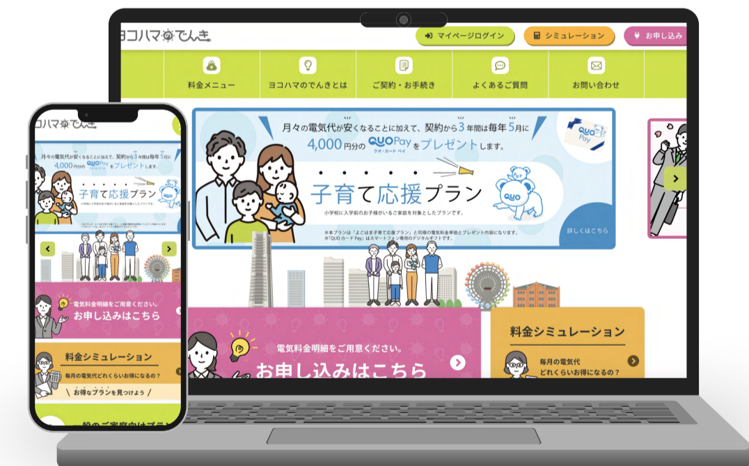
株式会社横浜環境デザイン 様 ヨコハマのでんき