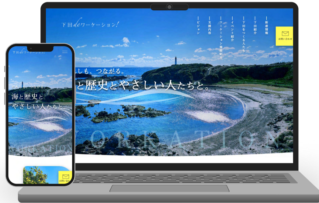
下田市役所 様 下田deワーケーション!

これまで個人や中小企業の方から、行政や大企業のプロジェクトまで幅広い実績が80件以上あります。