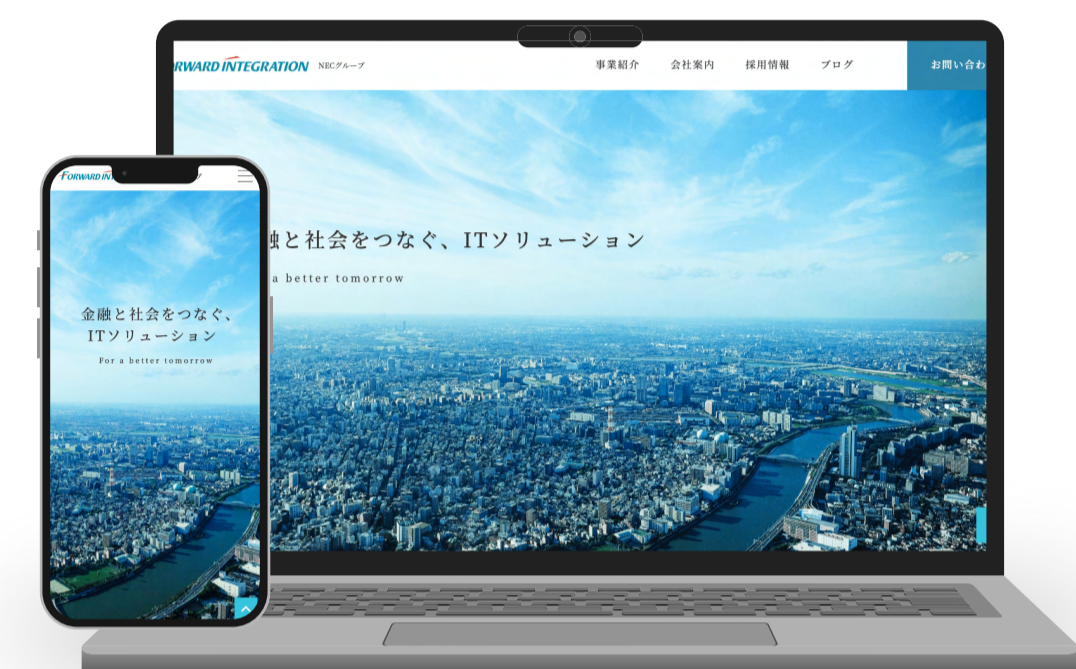
フォワード・インテグレーション・システム・サービス株式会社 様 ホームページ/採用サイト