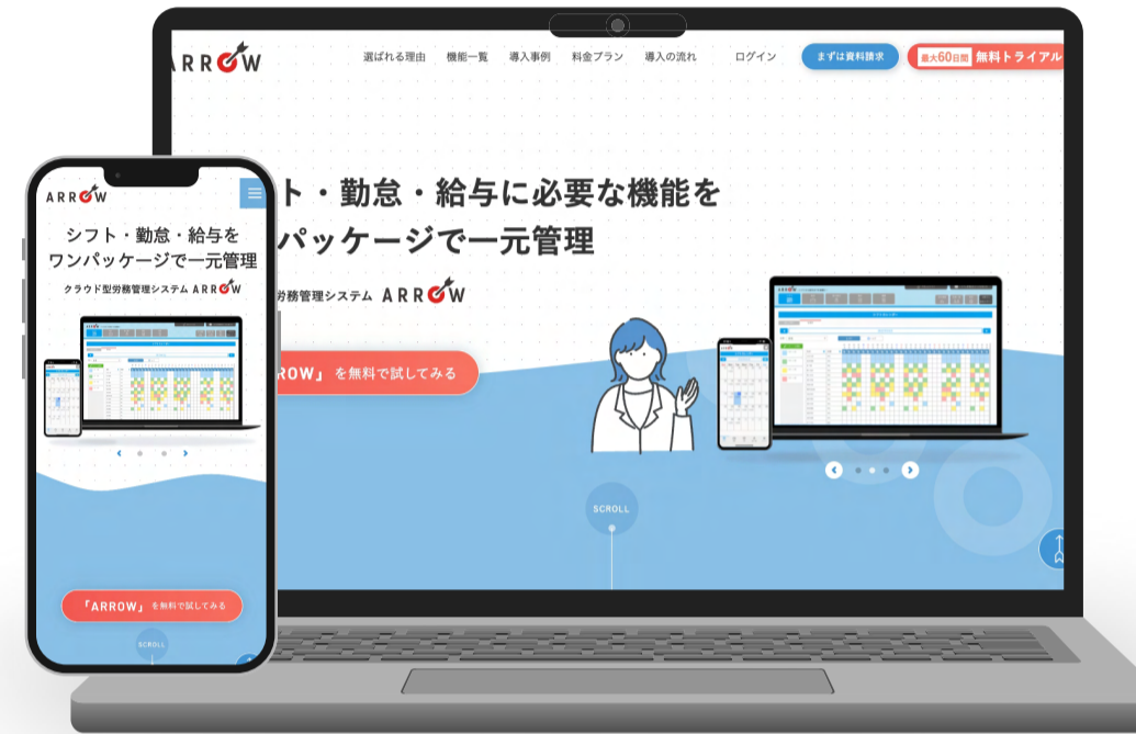
株式会社S&A 様 クラウド型労務管理システムARROW